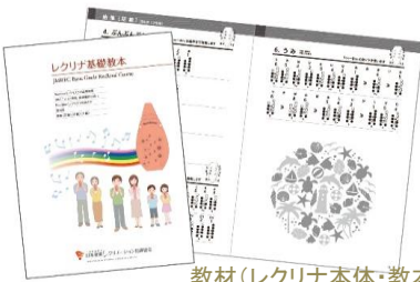
教材(レクリナ本体・教本)