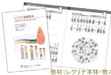
教材(レクリナ本体・教本)