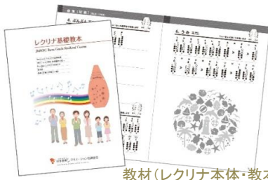
教材(レクリナ本体・教本)