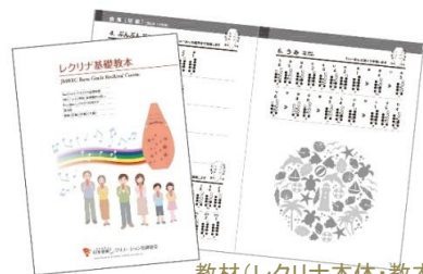
教材(レクリナ本体・教本)